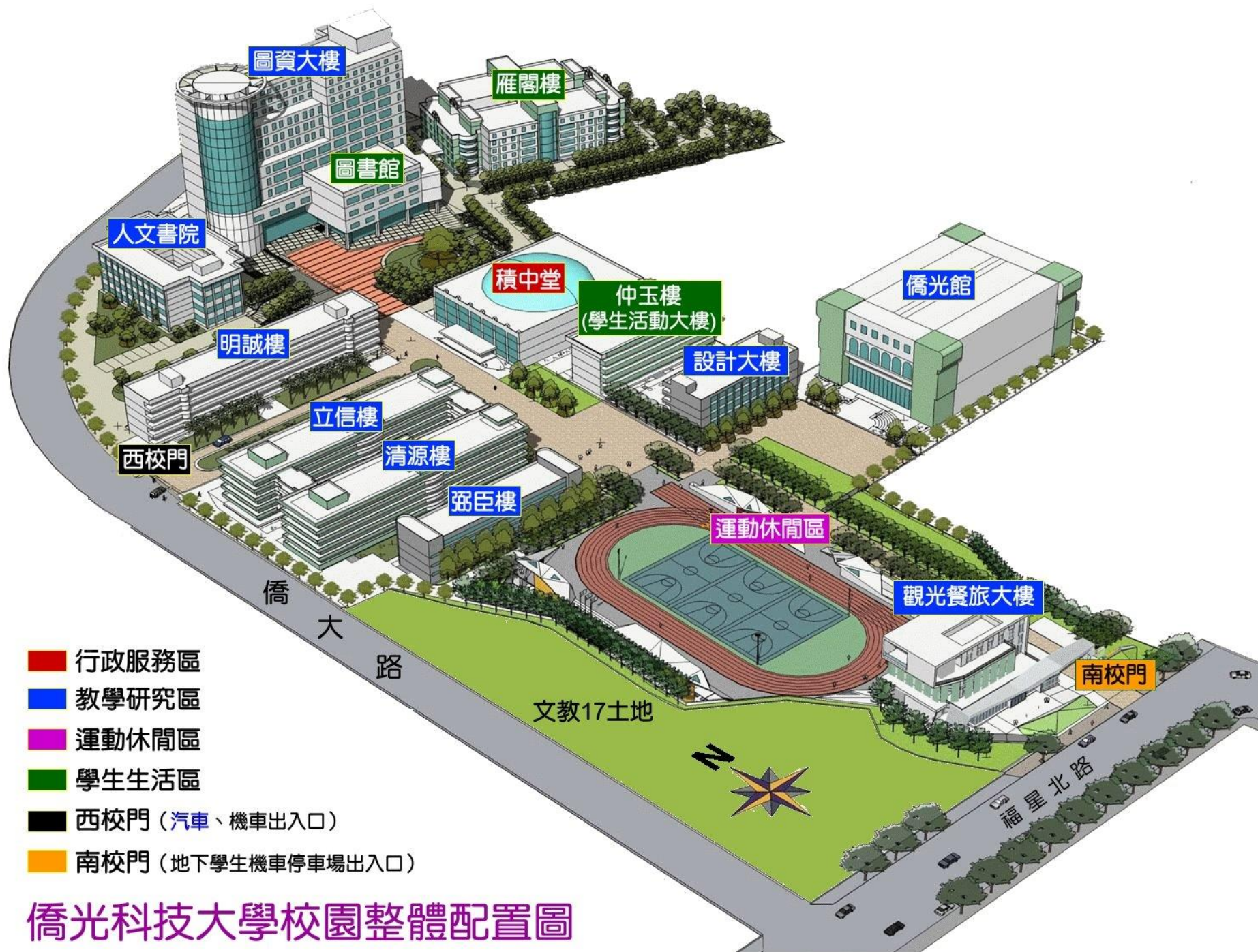
僑光科技大學校園整體配置圖